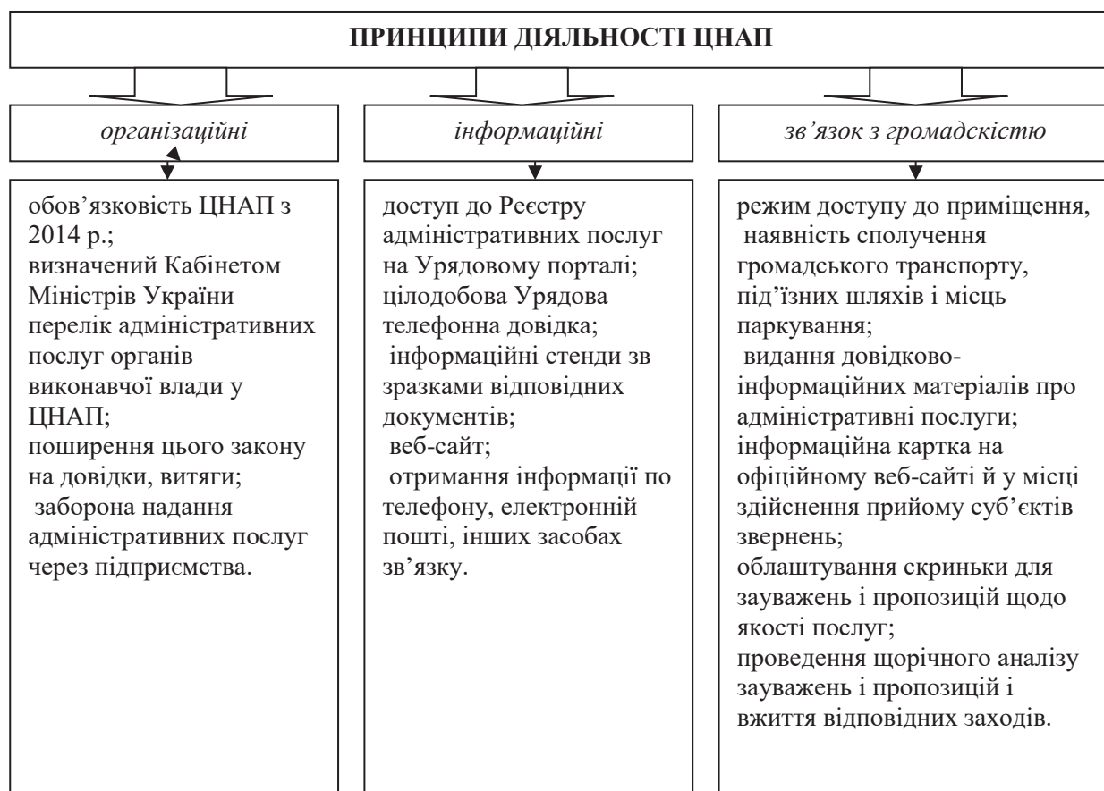
Рис. 1. Принципи діяльності ЦНАП згідно із Законом України «Про адміністративні послуги»

механізм надання публічних послуг становить основу функціонування влади в демократичному суспільстві [5].