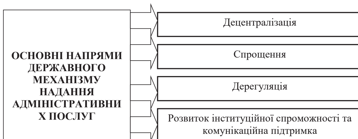
Рис. 4. Основні напрями розвитку державного механізму надання адміністративних послуг в Україні