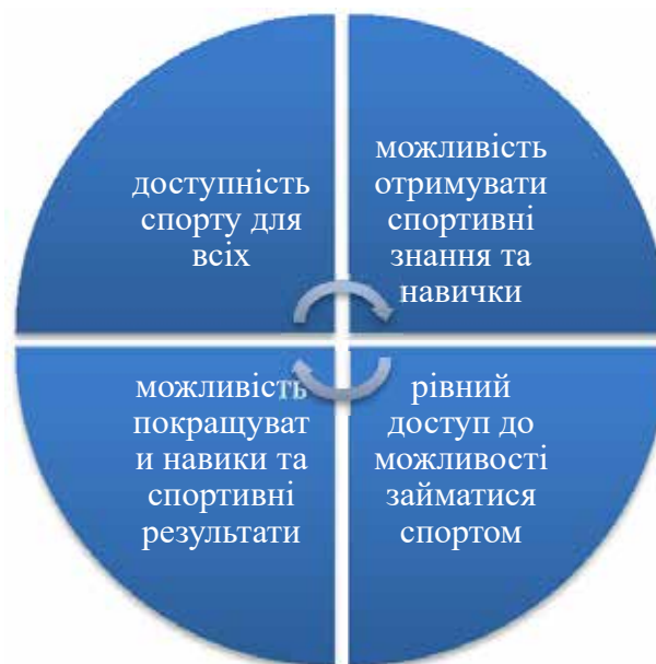
Рис. 3. Пріоритети Кодексу спортивної етики [8]

та спорту доцільно визначити, що провідні країни світу розглядають систему публічного управління галуззю через призму надання адміністративних послуг із фізичної культури та доступу до спорту. Відповідно базові пріоритет сформовані навколо цінностей людини, її вимог та запитів. Система пріоритетів з орієнтацією на людину сформувалася лише після Другої світової війни, тоді ж спорт почав розглядатися як форма бізнесу, що визначило