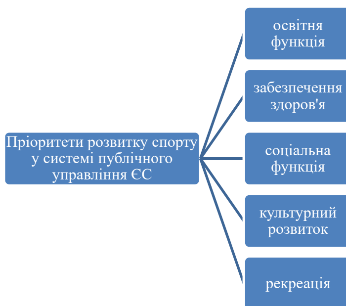
Рис. 4. Пріоритети нормативного забезпечення процесів публічного управління фізичної культури та спорту ЄС [1]

Ретроспективний аналіз нормативного забезпечення розвитку спорту представлений на рис. 5.