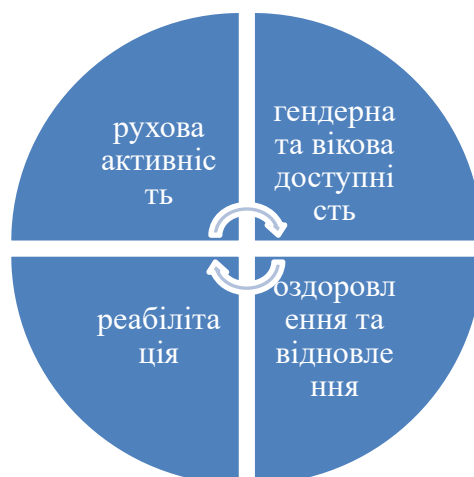
Рис. 2. Елементи регламентування Європейської спортивної Хартії [6]

Аналізуючи міжнародне та європейське законодавство у сфері фізичної культури