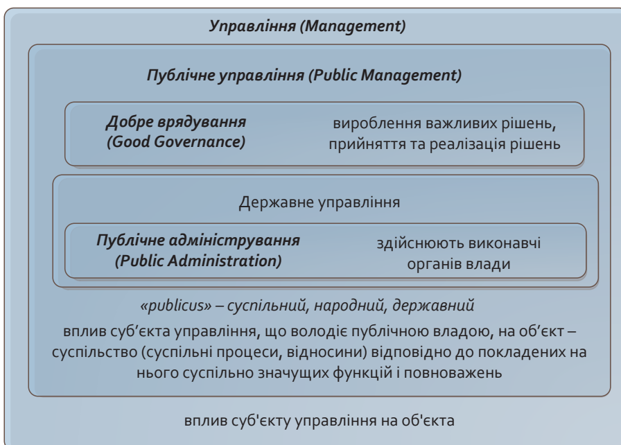
Рис. 2. Схема взаємозв'язку ключових категорій управлінської системи

лінський вплив у системі самоврядування, з одного боку, набуває ознак самовпливу (на власну життєдіяльність), а з іншого – такий вплив залишається управлінським. Участь у процесі підготовки, ухвалення, реалізації управлінських рішень та характер управлінських функцій у цьому процесі є важливими соціальними якими індивідів як суб'єктів управління, оскільки управлінські рішення відбивають інтереси громадянського суспільства саме тоді, коли люди беруть активну участь у всіх