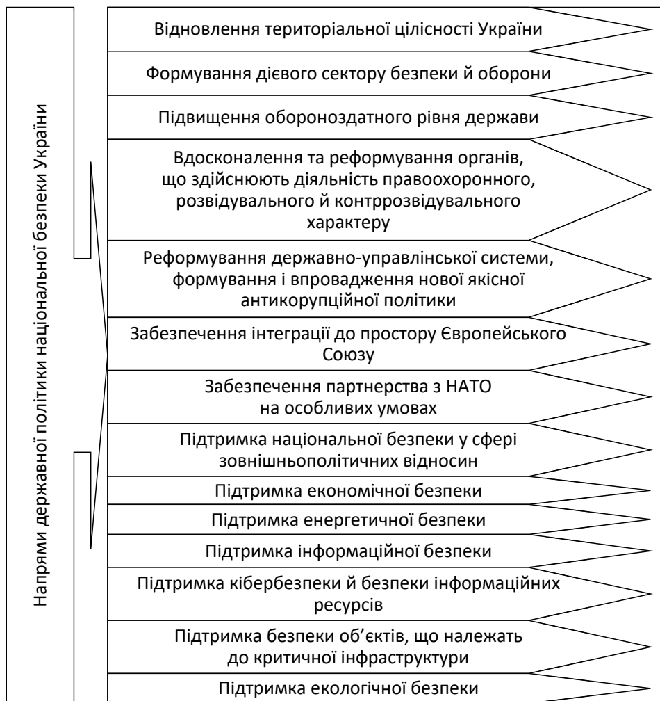
Рис. 2. Напрями державної політики національної безпеки України відповідно до Стратегії Національної безпеки України