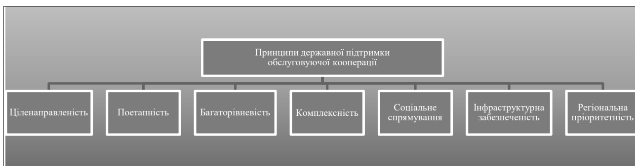
Рис. 2. Основні засади підтримки та розвитку обслуговуючої кооперації на державному рівні

на 24 одиниці, у Полтавській області – на 16 одиниць [3].