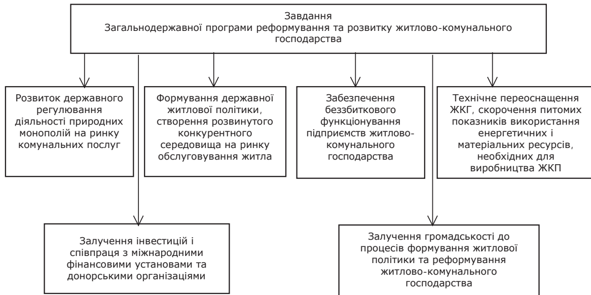
Рис. 1. Завдання Загальнодержавної програми реформування та розвитку житлово-комунального господарства

ності та надійності його функціонування, забезпечення сталого розвитку для задоволення потреб населення і господарського комплексу в житлово-комунальних послугах відповідно до встановлених нормативів і національних стандартів, було визначено основні завдання, що відображено на рис. 1 [6].