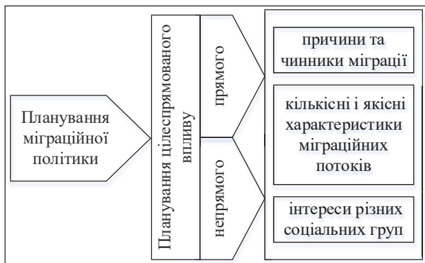
Рис. 2. Реалізація планування міграційної політики (розроблено автором)

сягнення конкретних показників розвитку міграційних процесів; здійснюється профільними інституціями управління міграцією. Планування непрямого впливу – це планування цілеспрямованого опосередкованого впливу на міграцію через явища і процеси, які, у свою чергу, є чинниками її розвитку; змінює динаміку і характер процесів, пов'язаних із міграцією; має на меті досягнення конкретних показників їхнього розвитку; здійснюється різними інституціями, які не є компетентними безпосередньо в управлінні міграцією. Ключовими результатами цього етапу є завершення планування міграційної політики.