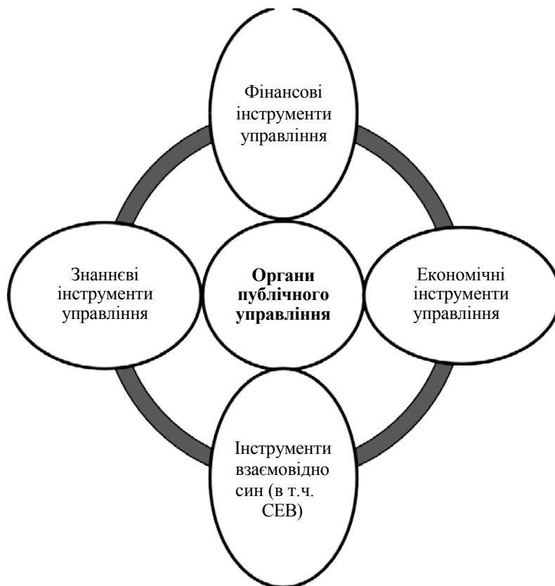
Рис. 3. Управлінський інструментарій задля реалізації системи суспільно-економічних відносин

Еволюція суспільно-економічних відносин на рівні територіальних громад розпочинається з активізації реформ щодо децентралізації влади та часткового відсторонення держави від прямого