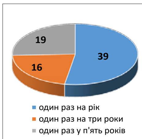
Рис. 2. Проходження респондентами курсів з підвищення кваліфікації (тренінгів, шкіл тощо) з управління у сфері охорони здоров'я (%)

На запитання «Що спонукає Вас до навчання (тренінгів, семінарів, круглих столів тощо)» більшість опитуваних відповіли: здобути нові, потрібні в роботі знання, вміння та навички (92%), налагодити корисні зв'язки у сфері професійної діяльності (58%), зробити внесок у розвиток охорони здоров'я України (49%), застосувати нові знання, вміння та навички на державній посаді (понад 40%), застосувати нові знання, вміння та навички в недержавному секторі (понад 28%), отримати підвищення по службі (19%). Близько двох відсотків опитуваних навели свій варіант відповіді на це питання та зазначили, що проходять навчання з метою розуміння як здійснювати свою діяльність у правовому полі та підвищення заробітної плати.