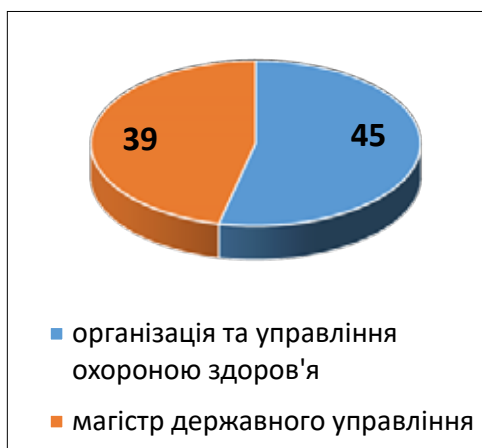
Рис. 1. Наявність у респондентів спеціальної освіти з управління у сфері охорони здоров'я (%)

Близько 80% опитуваних мають спеціальну освіту з управління (рис. 1).