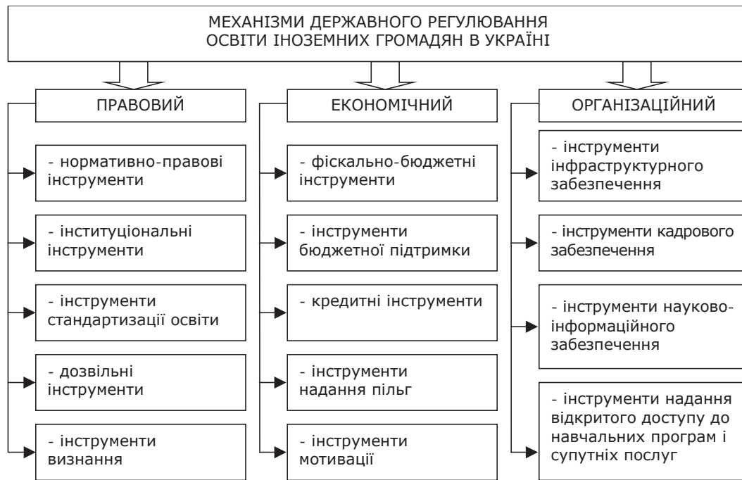
Рис. 2. Механізми та інструменти державного регулювання освіти іноземних громадян в Україні* *Складено на основі [2, с. 57].

Інструменти економічного механізму державного регулювання освіти іноземних громадян в Україні спрямовані на забезпечення фінансування доступності здобуття освіти для іноземців шляхом бюджетних та кредитних важелів або через надання пільг; створення мотиваційного поля для залучення іноземних студентів до навчання в Україні тощо.